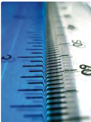
La méthode choisie dans ce Focus est le benchmarking avec les trois pays voisins.

Deux indicateurs permettant d'appréhender l'efficacité du fonctionnement des services publics sont analysés : l'emploi public et les coûts de fonctionnement. Suite à des modes d'organisation différents en termes de santé, d'enseignement, de transport, etc., ces deux indicateurs ne couvrent pas toujours la même réalité d'un pays à l'autre. Ainsi, en Allemagne, aux Pays-Bas et en Belgique, les hôpitaux ne sont pas comptabilisés dans le secteur des administrations publiques, alors qu'en France ils sont repris dans ce secteur. Afin d'éviter les écueils des différences de périmètre du secteur public entre pays, nous avons comparé des branches et fonctions du secteur public qui couvrent au mieux la même réalité dans les quatre pays analysés.