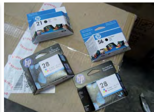
Les éléments révélateurs de la contrefaçon sont, entre autres, l'emballage.

en dents de scie. Ainsi, des mécanismes commerciaux obligeant les entreprises à suivre certaines procédures censées rendre la chaîne logistique plus transparente ont été mis en place. En échange, ces entreprises sont exemptées de contrôles. Or, on découvre aujourd'hui que ces 'green lanes' sont utilisées très assidûment par des entreprises malhonnêtes.