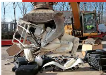
Le 16 février, la marque italienne de design Cassina a fait détruire une septantaine de meubles contrefaits du célèbre créateur Le Corbusier

Le 16 février, la marque italienne de design Cassina a fait détruire une septantaine de meubles contrefaits du célèbre créateur Le Corbusier par une société de recyclage à Vilvoorde. Par cette action, Cassina entendait donner un signal fort à l'industrie de la contrefaçon.